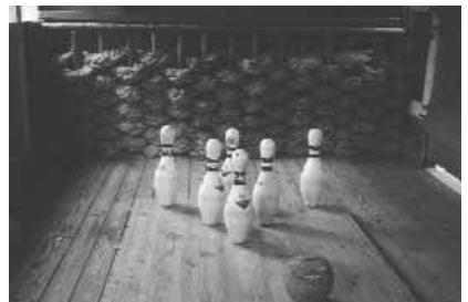
Original kule, men moderne kjegler