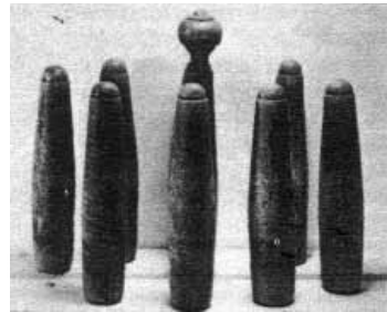
Kjegler fra «Byminner»