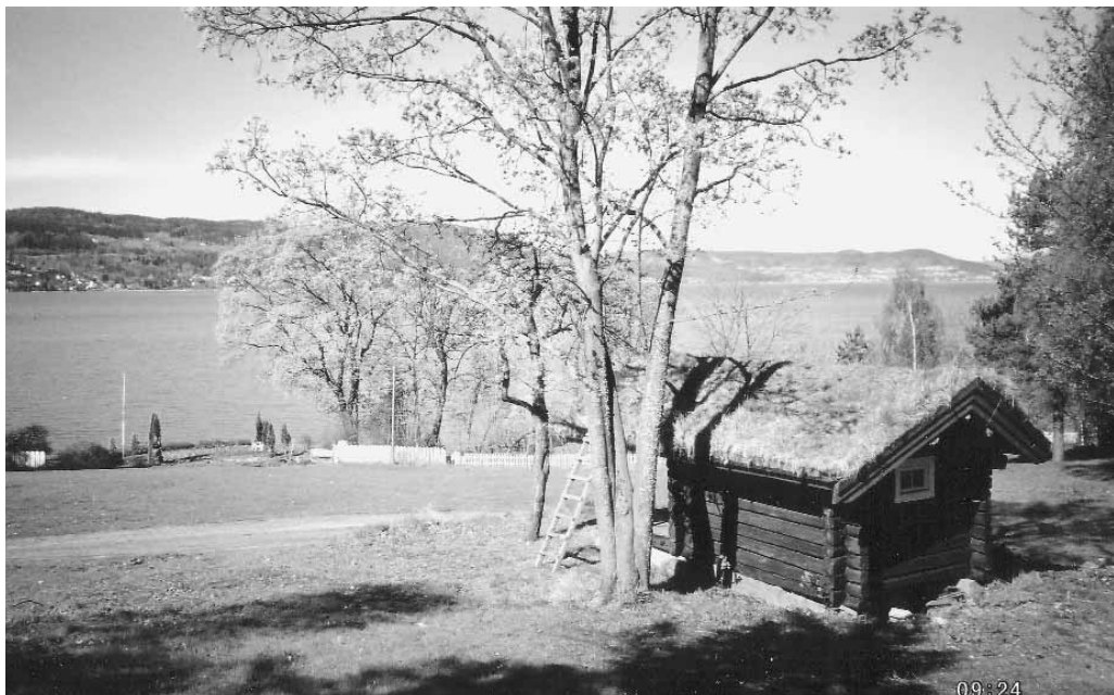
Laftehus på idylliske Hernestangen

det var lagt til onnetiden. Om sommeren var arbeidstiden fra 7 om morgenen til 19 om kvelden, og derfor tjente han også bedre om sommeren enn om vinteren. Den siste husmannskontrakten vi kjenner til i Røyken, omhandlet Haukelia som lå under Rud gård på Spikkestad. Den er fra 1921, og sønnen til den siste husmannen der lever ennå i beste velgående og er bosatt i Spikkestad sentrum.