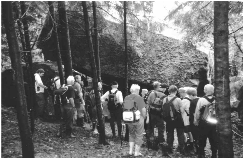
Fra Storsteinstua.