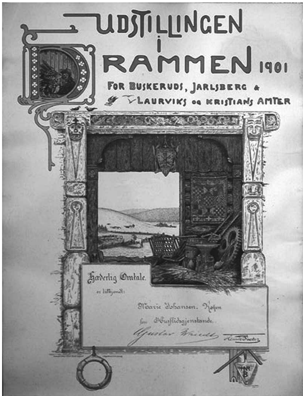
Diplom fra utstillingen i 1901. Utlånt av Aase Høvik