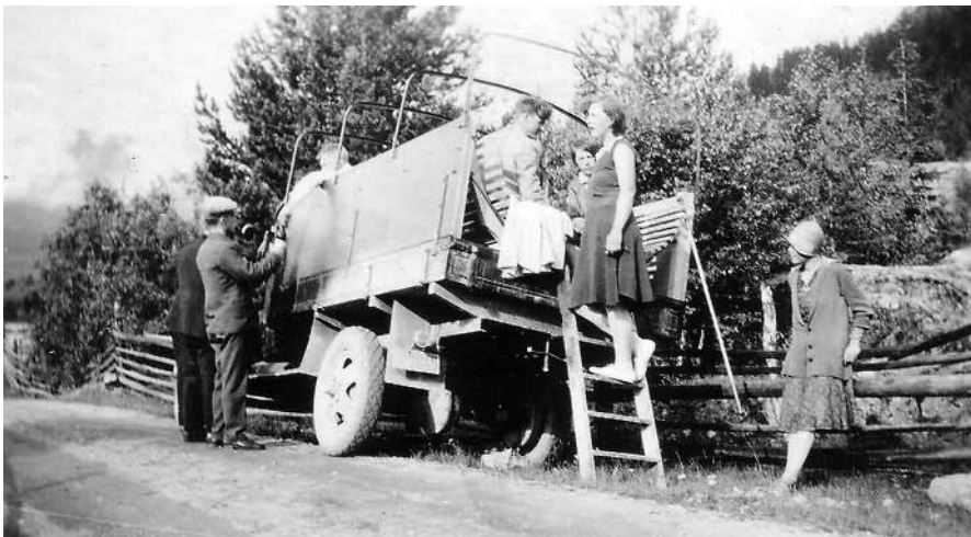
Klart for tur med gam- lebilen, utstyrt med hagekrakker