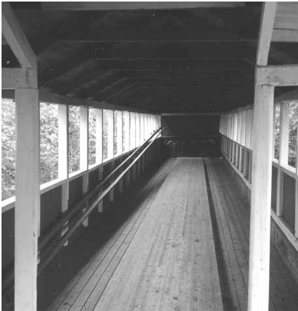
Fra banen i Volden, foto: Red.