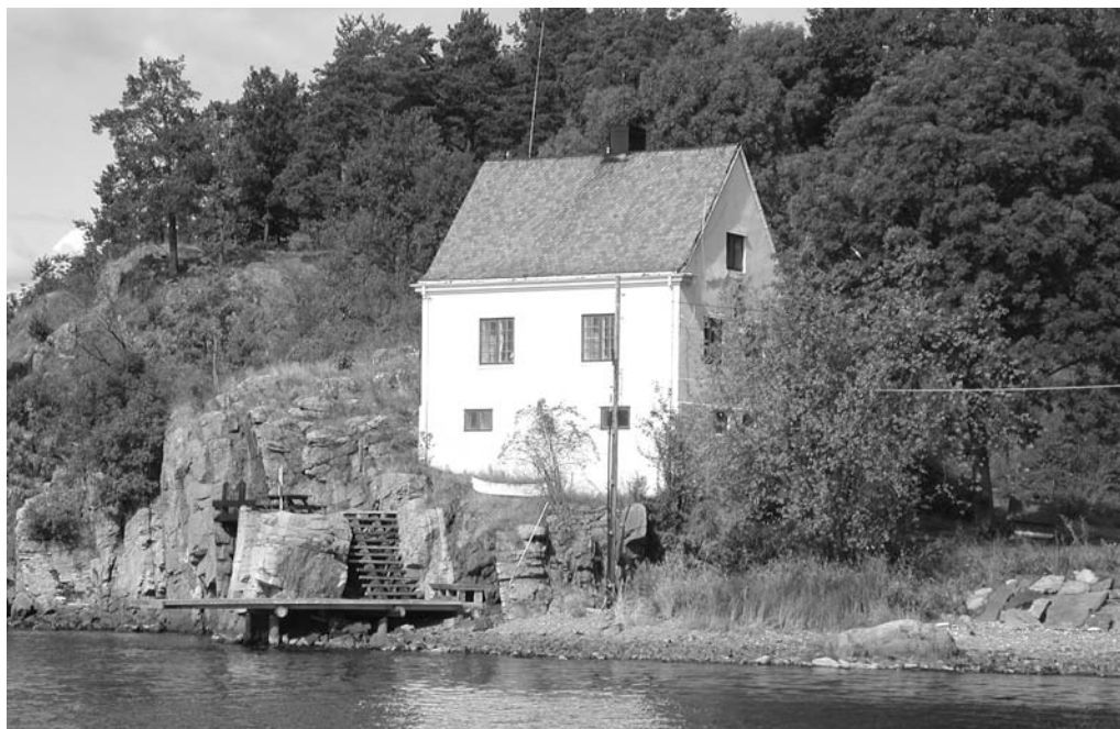
Vaktmesterboligen ved Tåjebukta

Det opplyses at som en følge av krigskonjunktorene var det full beskjeftigelse overalt og vanskelig å skaffe arbeidsfolk. Politiet i Christiania samlet sammen flokker av gatepiker og ekspederte dem utover til Haaøen. Mange kom