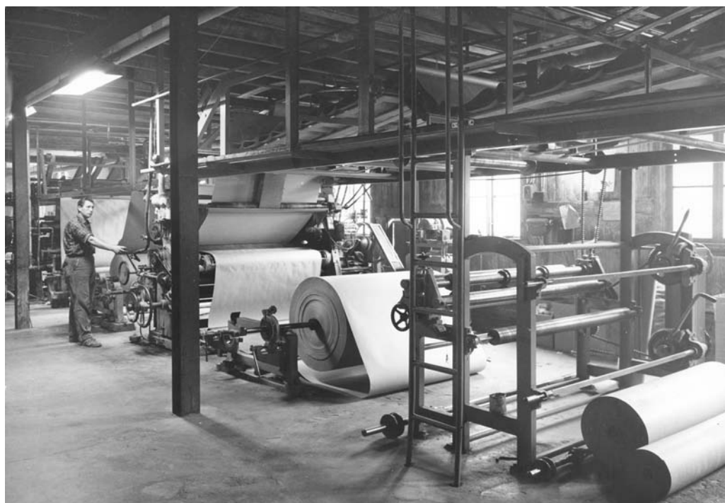
Mannen ved maskinen skal være Ottar Andersen

I 1962 ble imidlertid, til dyp beklagelse i Åros og Røyken; produksjonen flyttet til større lokaler på Hønefoss, og ca 1/3 av arbeidsstokken flyttet med.