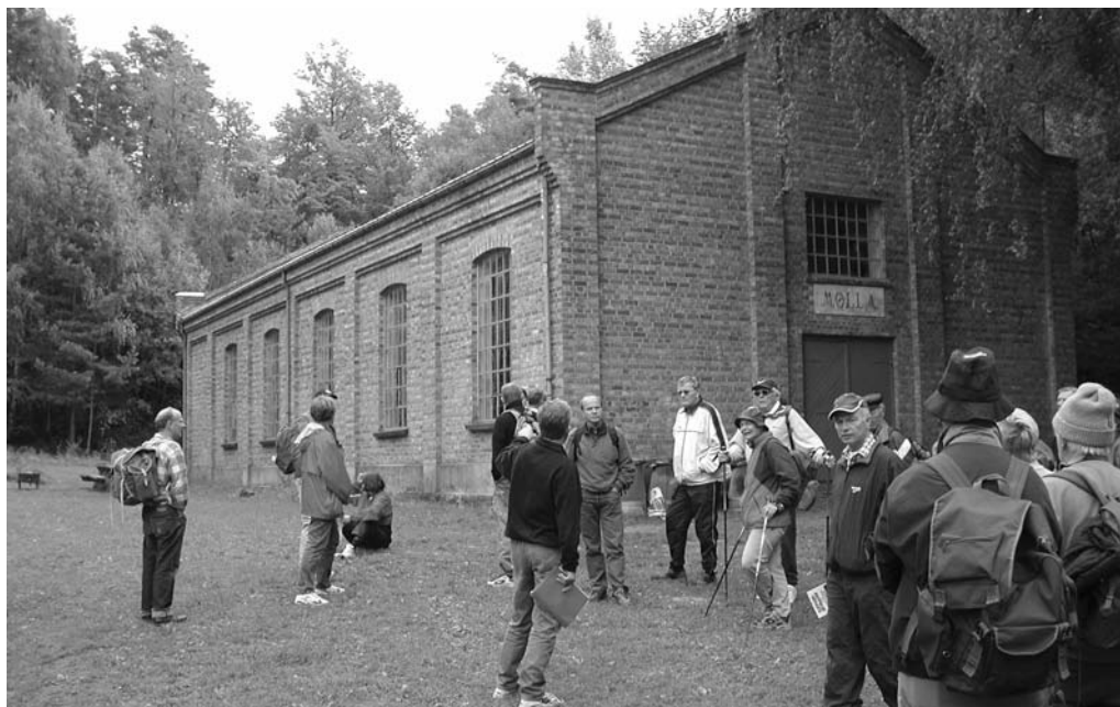
Den gamle kruttmølla

også direkte fra landsfengslet for kvinner. Det var ingen lett arbeidsstokk å holde styr på, men de var flinke til å arbeide og det påstås at arbeidet aldri har gått muntre for seg på sprengstoff-fabrikken. Produksjonsfabrikken lå på vestsiden av Mellomøya ( Tåjubukta ), mens de som arbeidet der bodde på østsiden, i Sagbukta. Navnet kommer forøvrig av sagbruket som lå her.