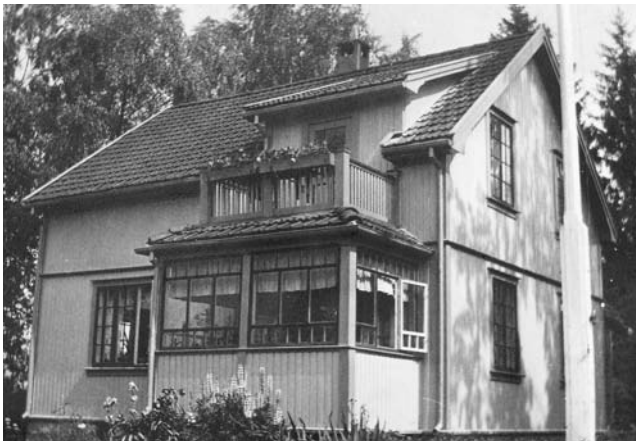
Bolighuset på Framnæs sett fra riksveien i slutten av 1930-åra.

Bolighuset ble oppført i 1923-1924 av en lokal byggmester, som vi ikke vet navnet på. Bildet fra slutten av 1930-åra viser huset slik det så ut fram til 1956. Dette er en halvannetasjes bygning, i bindingsverk og kledd med stående pløyd panel, med vinduer med småruter og flat teglstein på taket. Her er en glassveranda med valmtak og utgang til taket fra et oppløft i 2.