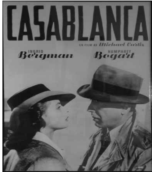
Kjente fjes på plakater