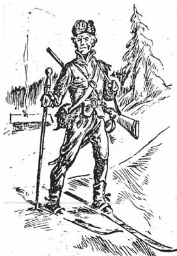
De norske soldatene brukte ski

I Sverige finnes en såkalt «folkvisa» fra denne tiden. Den skal være skrevet av en av soldatene som ble tatt til fange i slaget ved Trangen. Det er meget mulig at han har sittet nettopp i fangeleiren på «Svenskesletta» og beskrevet sin elendighet. I så fall betraktet han Hyggen som «det sämsta ställe som uti Norge var», som det heter i visen. Vi fant den i det svenske skriftet «Armborstet» fra året 1957.