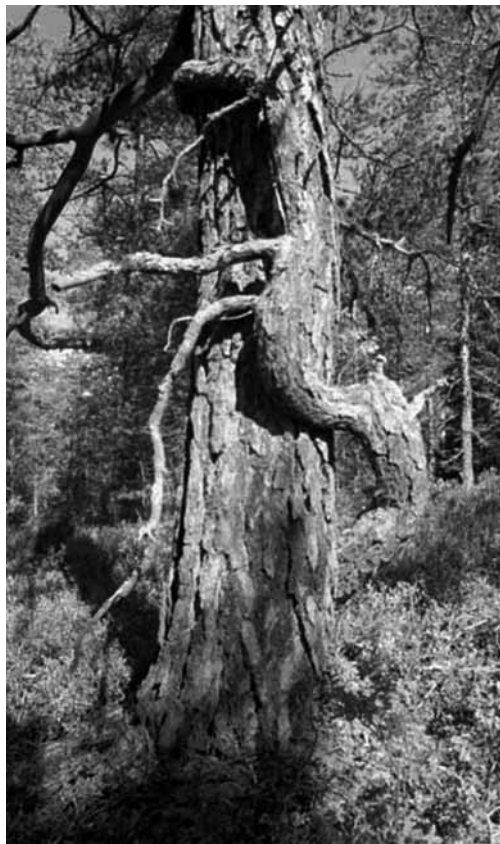
Foto av kronglefuru