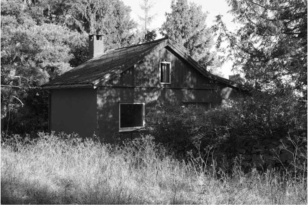
Åsen husmannsplass.