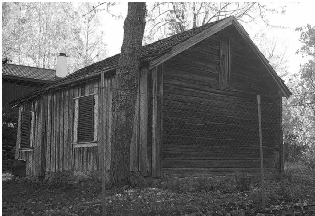
Svinghøgda er i dag beskyttet av et høyt gjerde.

Av andre plasser i denne kroken kan nevnes Åsen og Marenstua.