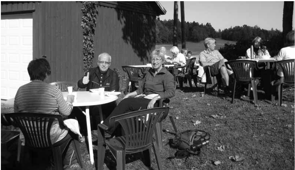
Supperast på Bø.