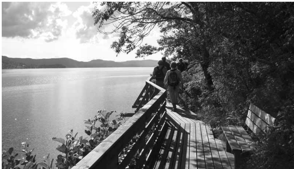
Gangbrua langs Helgåsen.