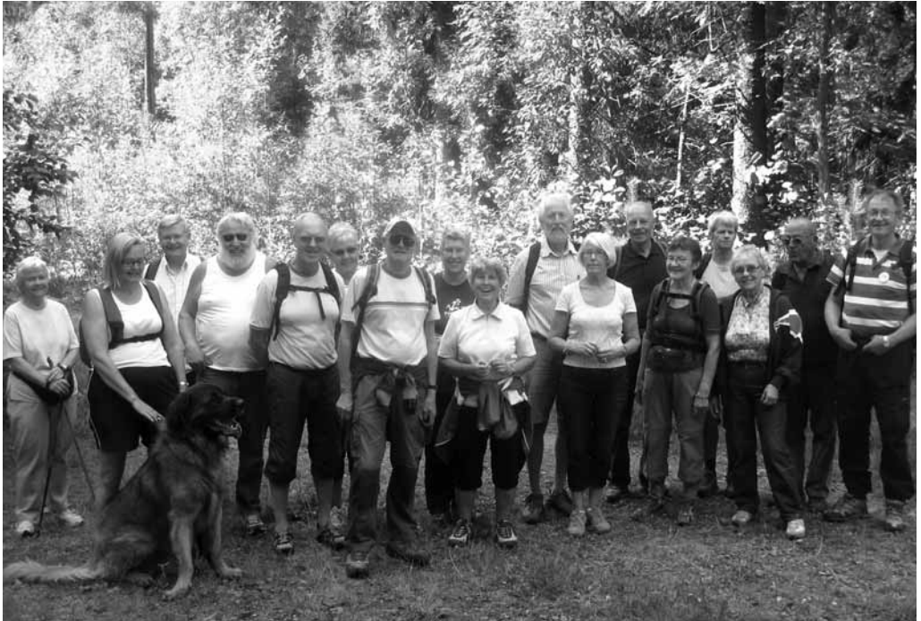
Glade turfolk i nydelig høstvær.