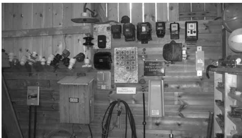
El- museum på gang?