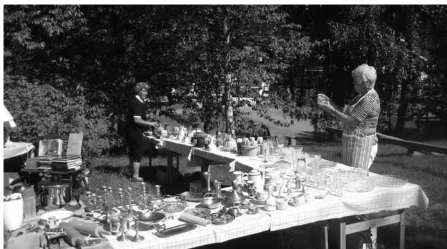
Frøydis og Gerd styrer «brukt- markedet»

Det ble solgt vafler, is, brus og kaffe fra Salen, og det var også mulig å kjøpe våre årbøker, bygdebøker, kart med mer.