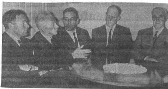
Kommitéen som skal forsøke å vekke interessen for dannelsen av et historielag i Røyken 1965.

En så betydelig og nyansert kommune bør få sin bygdebok