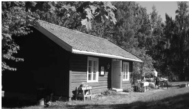
Gjellumstua, et besøk verd.

Vi lagde en «kuul-tur sti» for familier/-grupper rundt på området, med basis i historie og natur og med premiering til deltagerne.