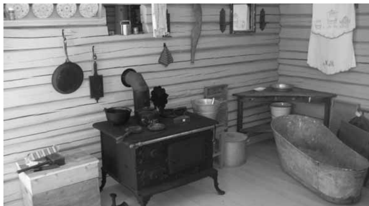
Kjøkkenet i Gjellumstua