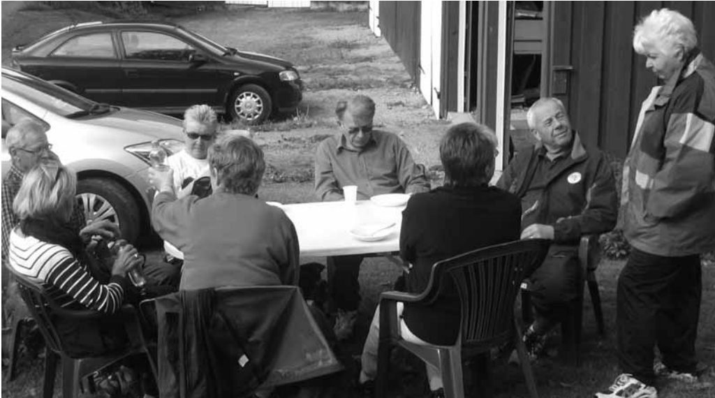
Gamle naboer slår av en prat ved suppebordet.