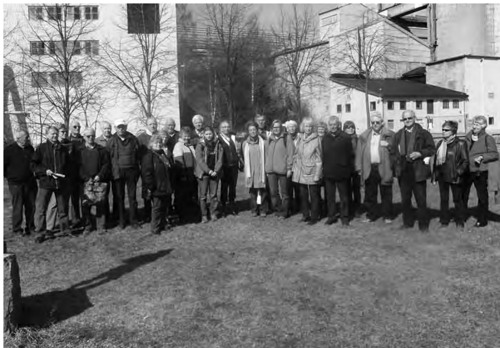
Kursdeltagerne med fabrikkannlegget i bakgrunnen

om husmannslivet ble tatt med. Det ble også henvist til tidligere Årbøker og Bygdemagasinene om emnet. Vi fikk også en kort innføring i kirka i Røyken med bl.a. av noen av prestene fra gammelt av og av Røyken kirkes eiere. Det var først i 1849 at Røyken kommune er eier av kirka.