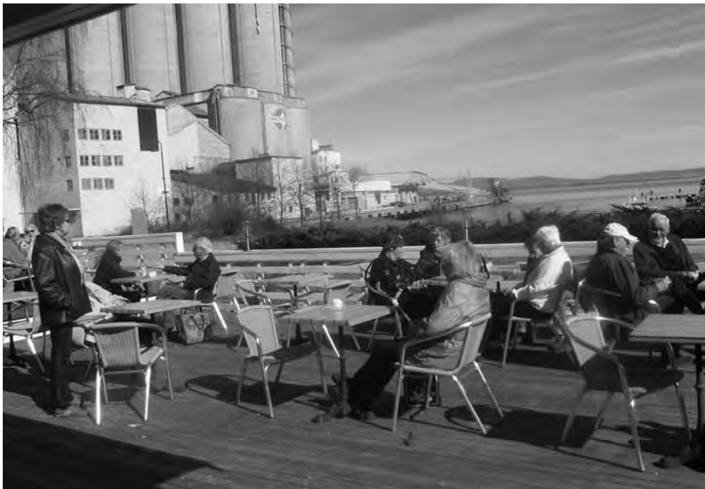
Matpause på Kroa i Slemmestad