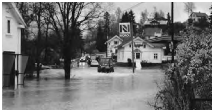
Fra Røyken i 1964, Skithegga på sitt frodigste!