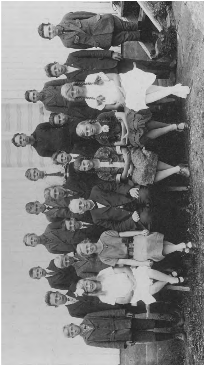
Vi utfordrer våre lesere! Drar noen kjensel på personer på disse bildene? Vi hører svært gjerne fra dere. RED.