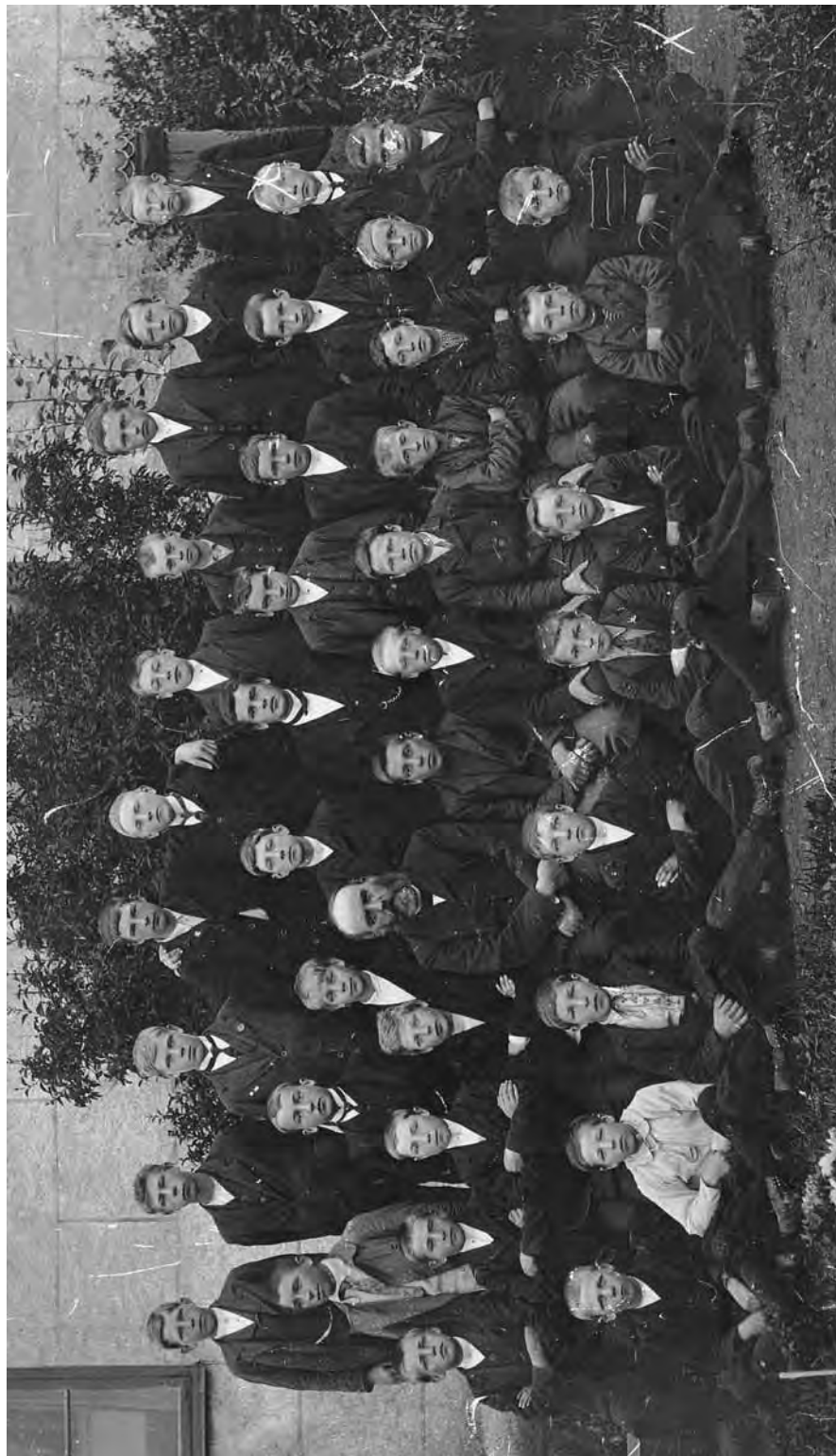
Vi utfordrer våre lesere! Drar noen kjensel på personer på disse bildene? Vi hører svært gjerne fra dere. RED.