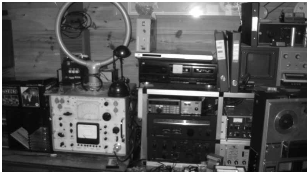
Det er vanskelig å kaste! Elektronikk av alle slag er gøy å ta vare på.