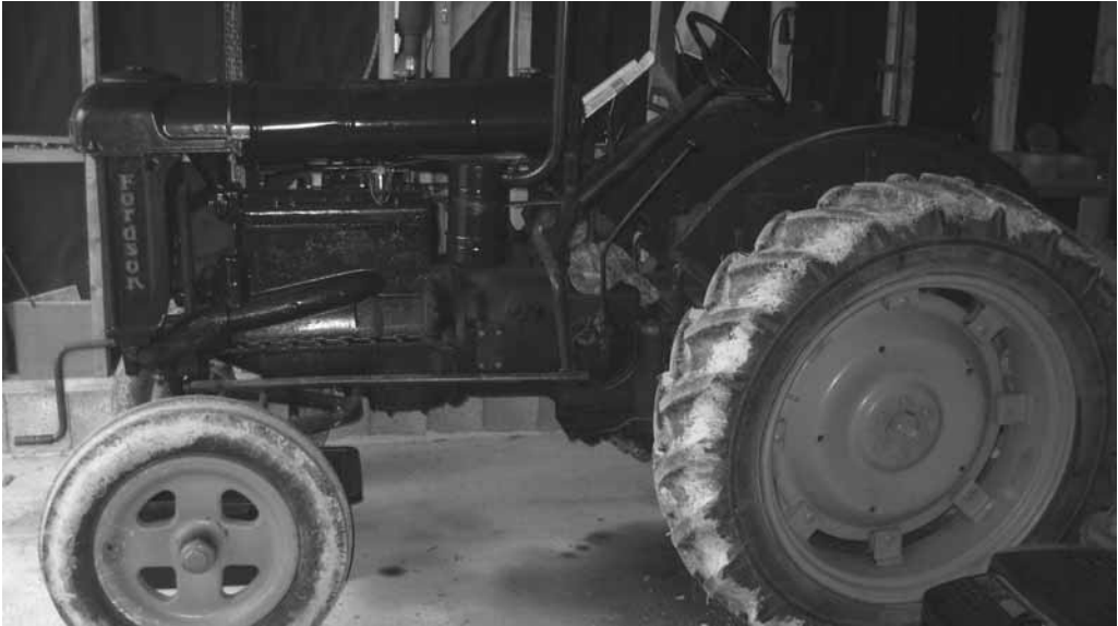
Denne Fordson Major traktoren fra 1947 framstår nesten som ny av året