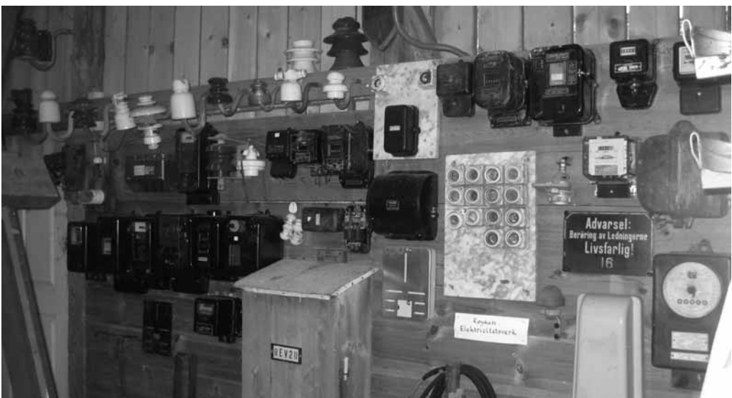
El-tavle på Hernestangen