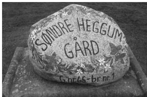
Tunstein, dekorert etter fruens ide.

Hovedbygningen har stått som den ble bygget i 1934, med bare mindre endringer. Det