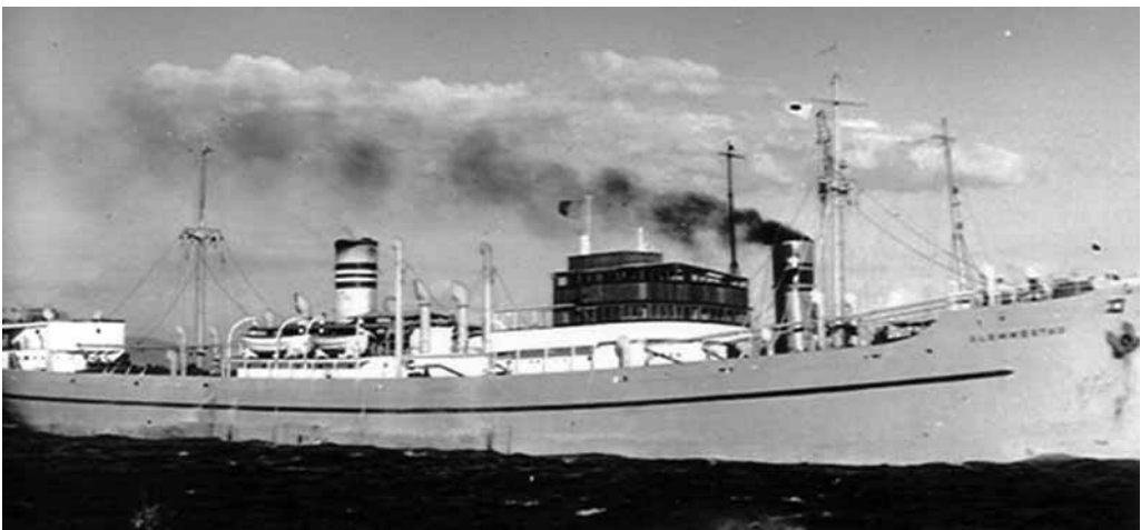
M/S Slemmestad fotografert i Cape Town på vei nordover til Øst Afrika. Skipet blir assistert av den store kullfyrt slepebåten "T.S. McEwen", som gjorde tjeneste i Cape Town fra 1925 til 1977, da den ble senket utenfor kysten.