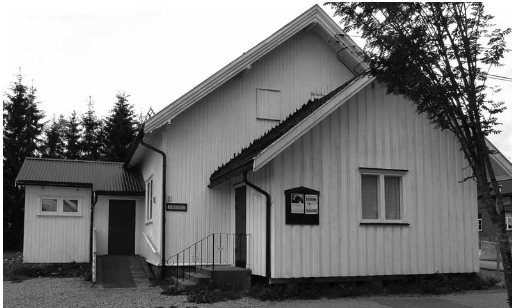
Vårsol i dag, sett fra Spikkestadveien.